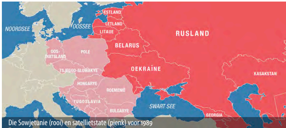
Die Sowjetunie (rooi) en satellietstate (pienk) voor 1989