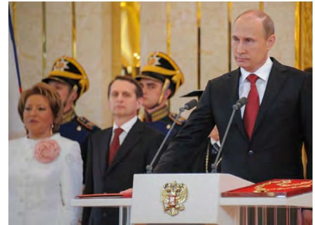
President Vladimir Poetin glo sy missie is om Rusland terug te neem na sy vorige glorie as 'n wêreldsupermoondheid.

Dit het direk gelei tot die ontbinding van die USSR op 26 Desember 1991—die verskillende lande van die unie het nou